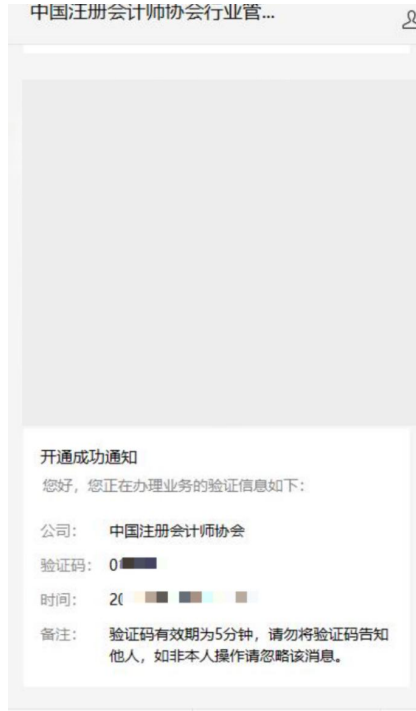
2-2 微信公众号验证码接收界面