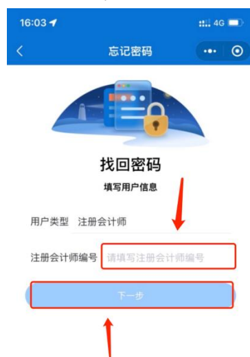
1-4 会员编号填写界面