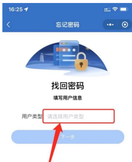
1-3 用户类型选择界面