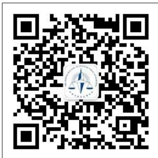
1-1 中国注册会计师协会行业管理信息系统公众号二维码 1-2