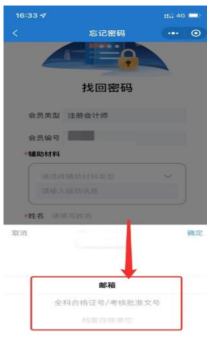
1-9 辅助材料类型选择界面